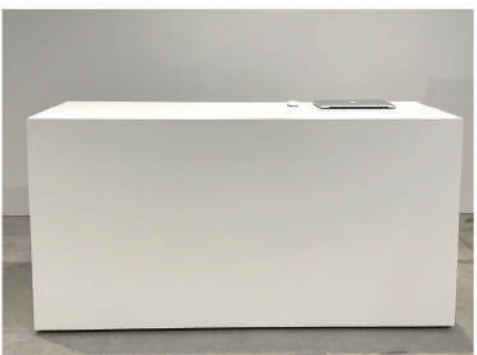
⑰ 白ボックス什器 特大