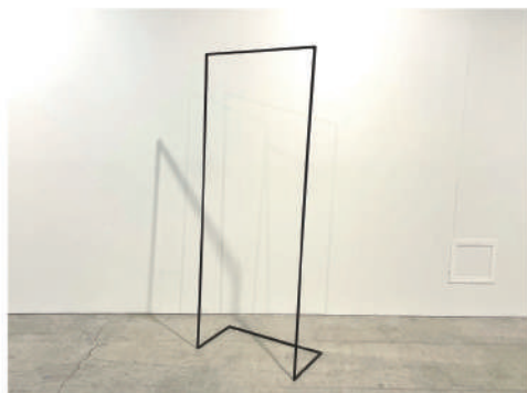
㉑ ハンガーラック 中