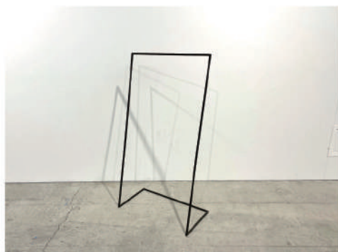
㉒ ハンガーラック 小