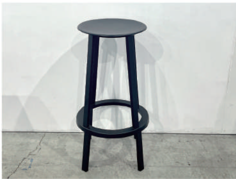
⑬ 回転イス high