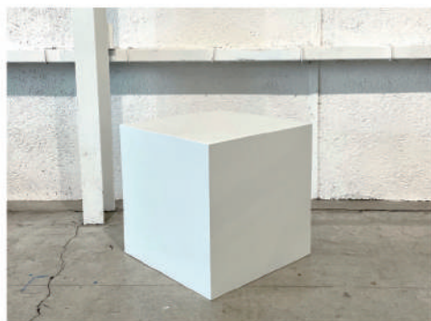
⑭ 白ボックス什器 小