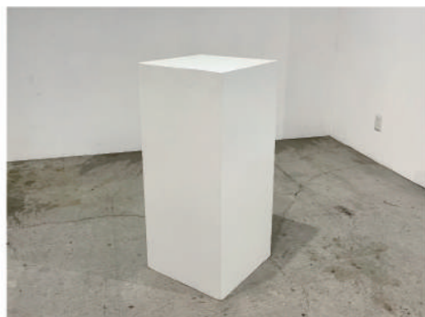
⑮ 白ボックス什器 中