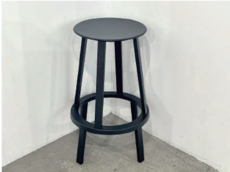
⑫ 回転イス low