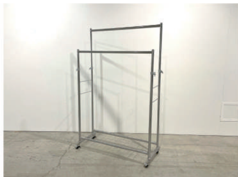
⑳ ハンガーラック 大